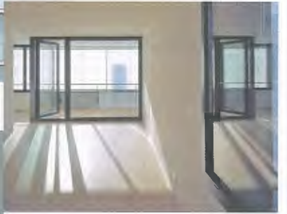
∨ 4_Wohnanlage Eichgut, Winterthur.