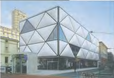
>7_La Miroiterie, Lausanne.