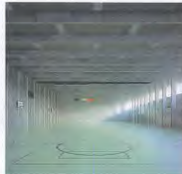
> 14_Schulhaus Falletsche, Zürich-Leimbach.