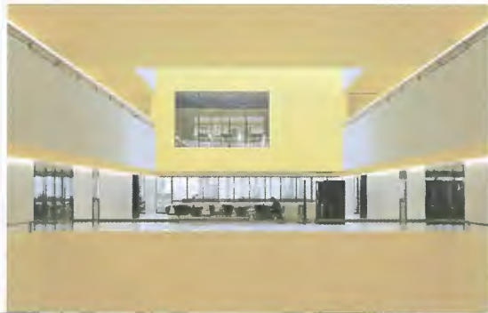
<2_E-Science Lab, ETH Hönggerberg, Zürich.