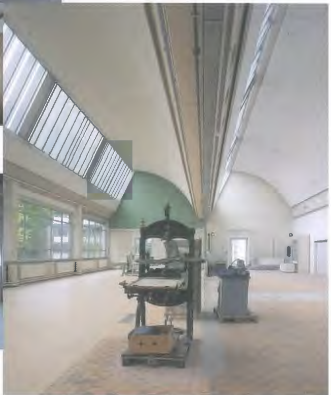
> 15_Fabrikumbau für die HKB, Bern.