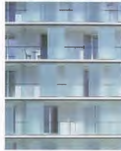
^ 3_Wohnanlage Achslengut, St. Gallen.