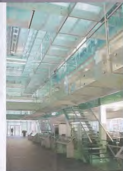
<10_Medienhaus Werd, Zürich.